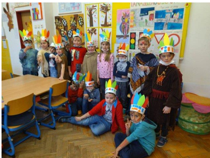
1.A Indiánský den