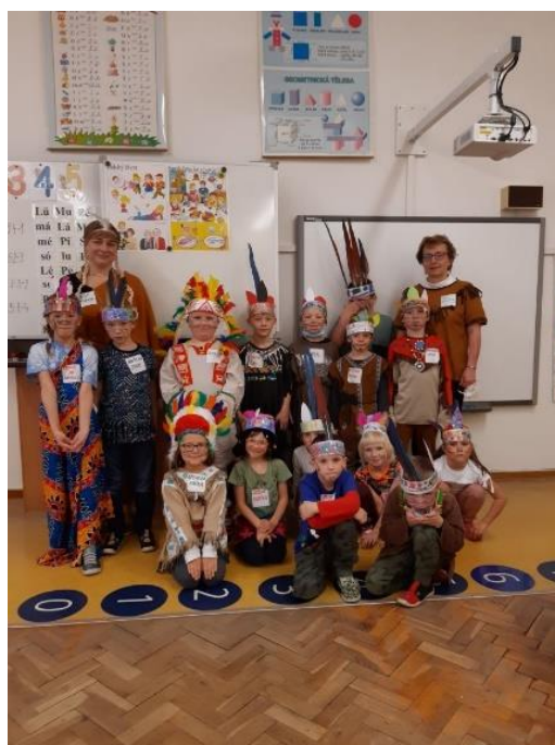
1.B Indiánský den